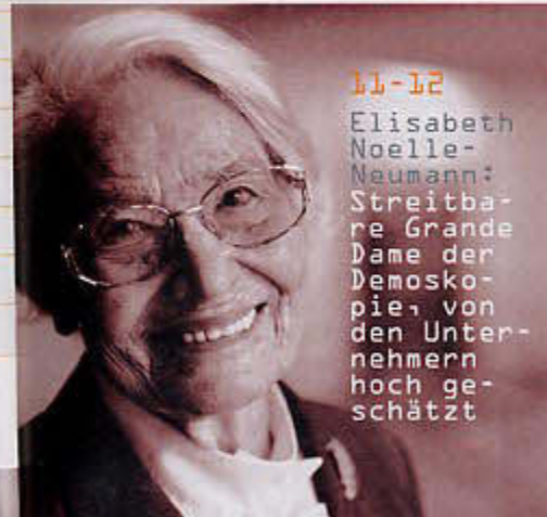
11-12 Elisabeth Noelle-Neumann: Streitbare Grande Dame der Demoskopie, von den Unternehmern hoch geschätzt