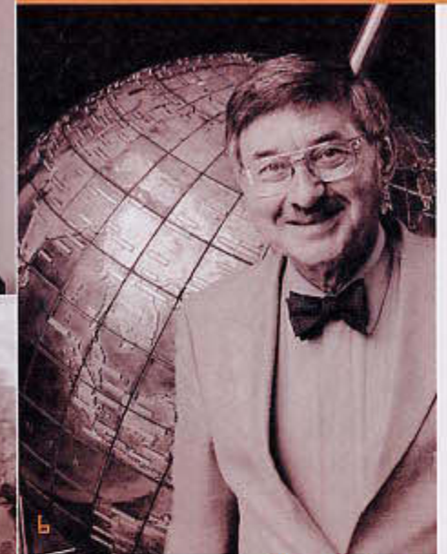
Horst Siebert: Der meistgelesene deutsche Volkswirt, kämpft standhaft für die Marktwirtschaft.