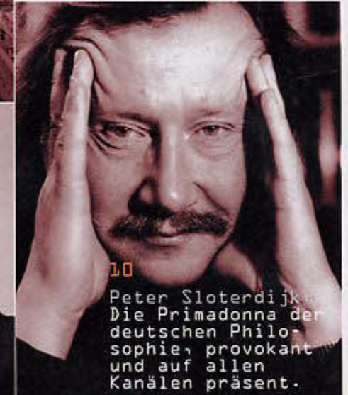
10 Peter Sloterdijk: Die Primadonna der deutschen Philosophie, provokant und auf allen Kanälen präsent.