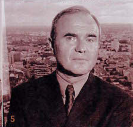
Otmar Issing: Der Chefvolkswirt der Europäischen Zentralbank, der diesem Berufsstand große Ehre macht.