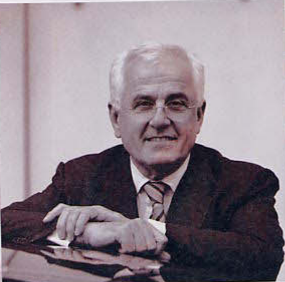
3 Peter Hartz: VW-Manager soll Arbeit und SPD wieder Zukunft geben. Hohe Medienpräsenz und Unternehmerbewertung.