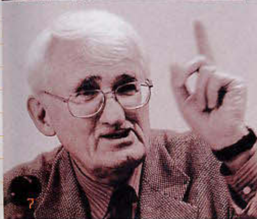
Jürgen Habermas: Primus der Frankfurter Schule, seit vier Jahrzehnten die tragende Säule deutscher Diskurskultur.