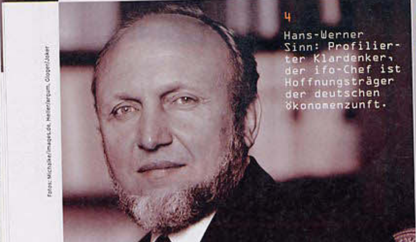
4 Hans-Werner Sinn: Profilierter Klardenker, der ifo-Chef ist Hoffnungsträger der deutschen Ökonomiezeit.