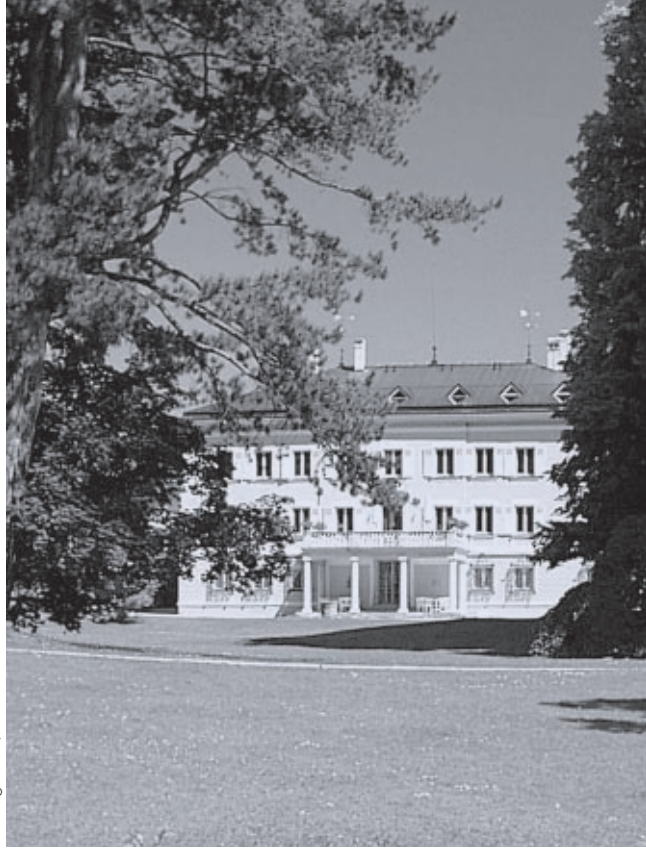
Evangelische Akademie Tutzing